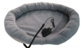
HEATED ANIMAL DEN CR 7431