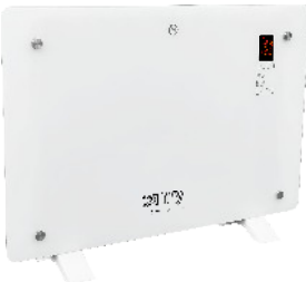
GLASS HEATER CR 7721