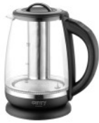
ELECTRIC KETTLE CR 1290