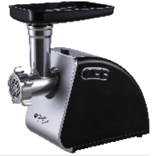
MEAT MINCER CR 4812