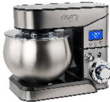
FOOD PROCESSOR CR 4223