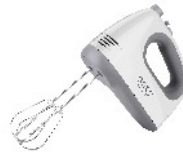
MIXER CR 4220