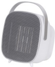
CERAMIC FAN HEATER CR 7732