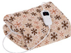
HEATING UNDERBLANKET CR 7430