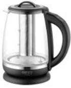
ELECTRIC KETTLE CR 1290