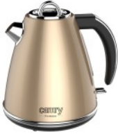
ELECTRIC KETTLE CR 1292