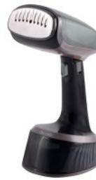
GARMENT STEAMER CR 5033