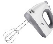
MIXER CR 4220