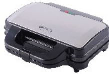
SANDWICH MAKER CR 3054