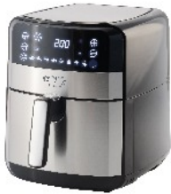
AIR FRYER OVEN CR 6311