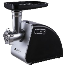
MEAT MINCER CR 4812