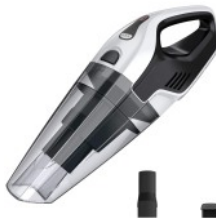
BAGLESS VACUUM CLEANER CR 7046