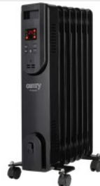
OIL FILLED RADIATOR CR 7812