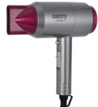
HAIR DRYER CR 2256