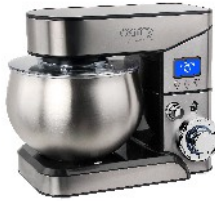
FOOD PROCESSOR CR 4223