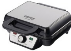
WAFFLE MAKER CR 3046