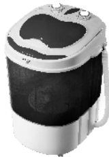
WASHING MACHINE CR 8054