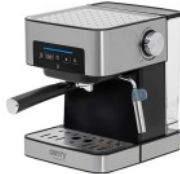
ESPRESSO MACHINE CR 4410