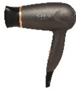
HAIR DRYER CR 2261