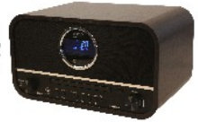
RETRO RADIO CR 1182