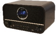
RETRO RADIO CR 1182