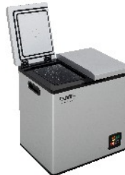
PORTABLE FRIDGE CR 8076