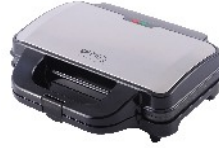
SANDWICH MAKER CR 3054