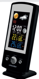
Weather Station MS 1177