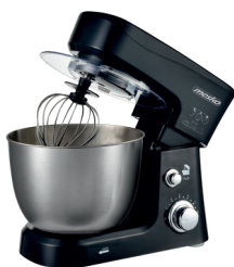
MIXER WITH BOWL MS 4217