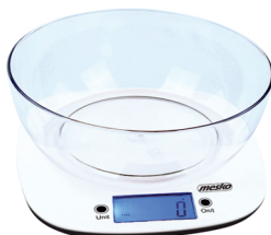
KITCHEN SCALE MS 3165