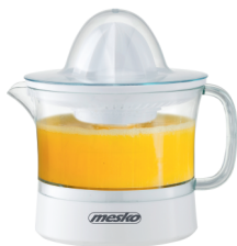
CITRUS JUICER MS 4010