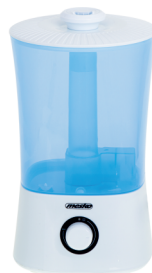
AIR HUMIDIFIER MS 7965