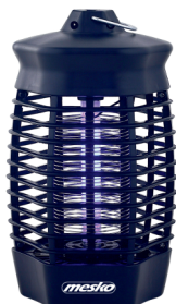
MOSQUITO KILLER LAMP MS 7933