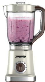
BLENDER WITH JAR MS 4079