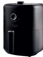
AIR FRYER AD 6310