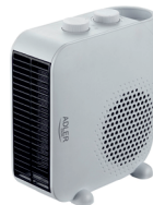
FAN HEATER AD 7725