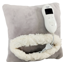
HEATED PAD AD 7412