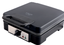
WAFFLE MAKER AD 3049