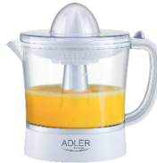
CITRUS JUICER AD 4009