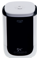
AIR HUMIDIFIER AD 7966