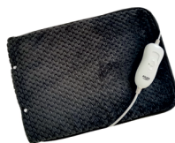
HEATED PAD AD 7433