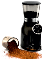
Burr Coffee Grinder AD 4450