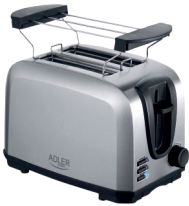
TOASTER 2 SLICE AD 3222