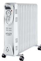
OIL-FILLER RADIATOR AD 7811