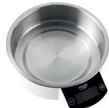
KITCHEN SCALE AD 3166