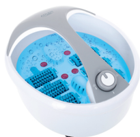
FOOT SPA AD 2177