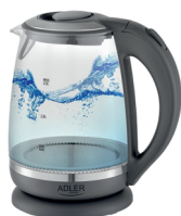
ELECTRIC KETTLE AD 1286