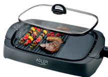
ELECTRIC GRILL AD 6610