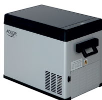
PORTABLE FRIDGE AD 8077