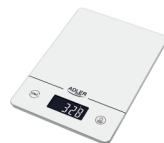
KITCHEN SCALE AD 3170