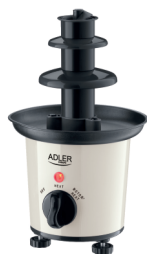
CHOCOLATE FOUNTAIN AD 4487