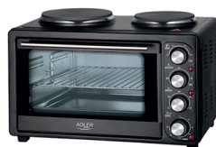
Electric Oven With HOB AD 6020