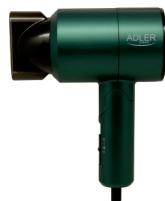
HAIR DRYER AD 2265