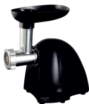
MEAT MINCER AD 4811