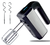
MIXER AD 4225