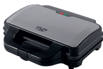
SANDWICH MAKER AD 3043