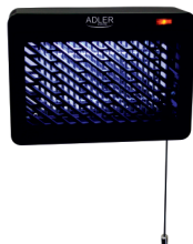
MOSQUITO LAMP AD 7938