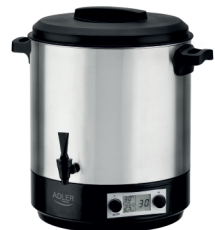
PASTEURIZATION POT AD 4496