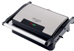
ELECTRIC GRILL AD 3052