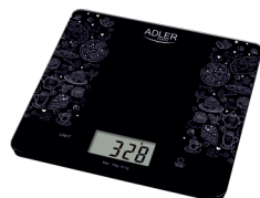
KITCHEN SCALE AD 3171