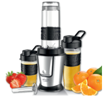
PERSONAL BLENDER AD 4081