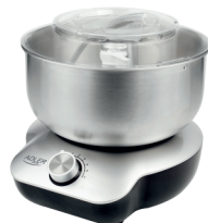
MIXER WITH BOWL AD 4222