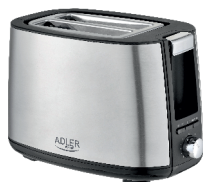
TOASTER 2 SLICE AD 3214