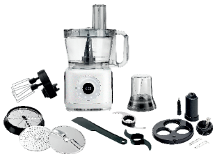
FOOD PROCESSOR AD 4224