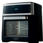
AIR FRYER OVEN AD 6309