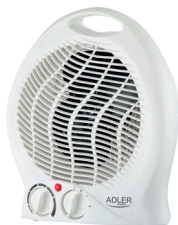
FAN HEATER AD 7728