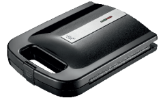
Sandwich Maker AD 3055