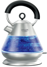
Electric Kettle AD 1282